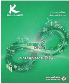
บริษัทจดทะเบียนที่ปรึกษา