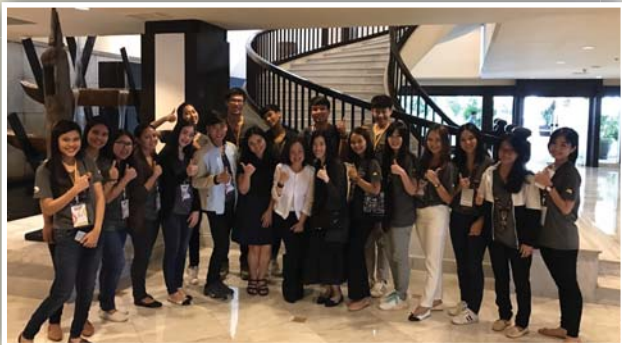
บริษัท ไมเนอร์ อินเตอร์เนชั่นแนล จำกัด (มหาชน)