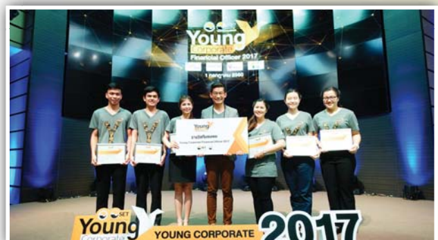
รองชนะเลิศอันดับ 2