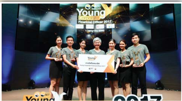
รางวัลชนะเลิศ