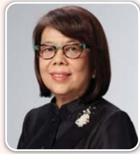
ดร. กุสuthira สิริโดม กรรมการอิสระ: กรรมการตรวจสอบ และกรรมการกึ่งกรรมเพื่อสังคม บมจ.ธนาคารไทยพาณิชย์