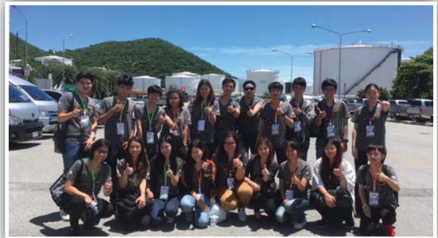
บริษัท ไทยออยล์ จำกัด (มหาชน)