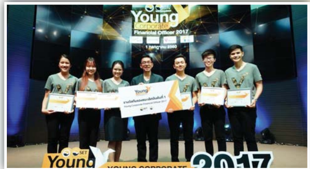
รองชนะเลิศอันดับ 1