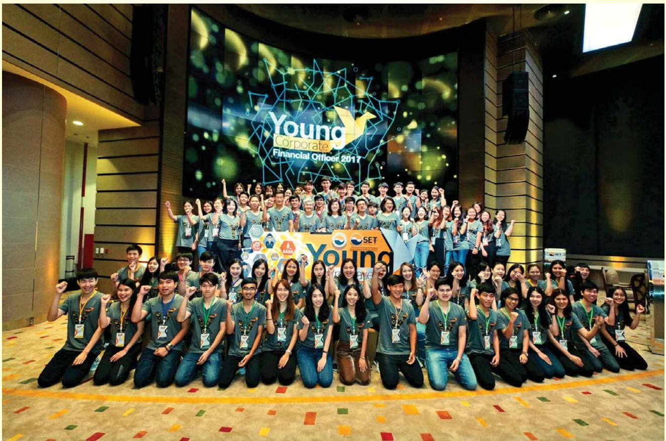
พิธีเปิดโครงการ Young Corporate Financial Officer 2017

ตลาดทุนไทยยังต้องการบุคลากรอีกจำนวนมากที่จะมีส่วน ในการขับเคลื่อนและพัฒนาเศรษฐกิจของประเทศให้เติบโตอย่างยั่งยืน สมามมา หวังว่า นิสิต นักศึกษาทุกคนในโครงการ จะเป็นคนอีกกลุ่มหนึ่งที่จะเข้ามาร่วมพัฒนาตลาดทุนไทยในอนาคตอันใกล้