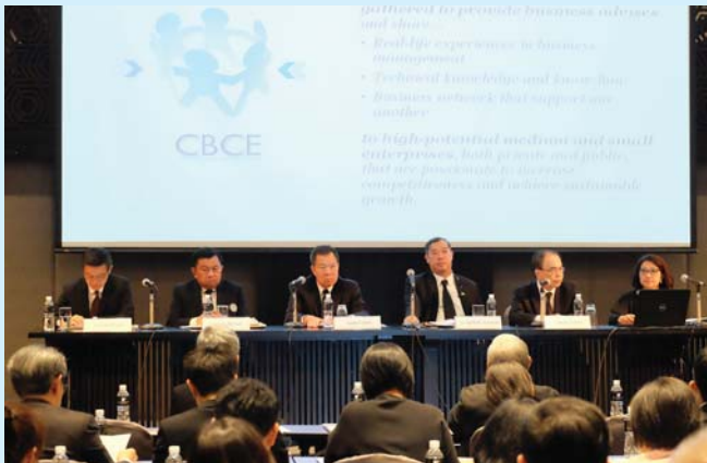
งานประชุมใหญ่สามัญสมาชิกรัฐสภาบริษัทจดทะเบียนไทย ประจำปี 2560 วันที่ 24 เมษายน 2560

Quarterly Newsletter Issue No. 42 July - September 2017