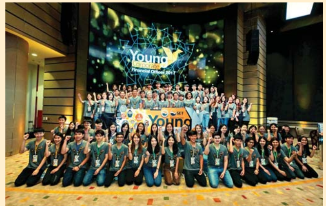
IR Club สมาคมบริษัทจดทะเบียนไทยร่วมกับ ตลาดหลักทรัพย์แห่งประเทศไทย โดยศูนย์ส่งเสริมการพัฒนาความรู้ตลาดทุน จัดโครงการ Young Corporate Financial Officer 2017 (YFO 2017)