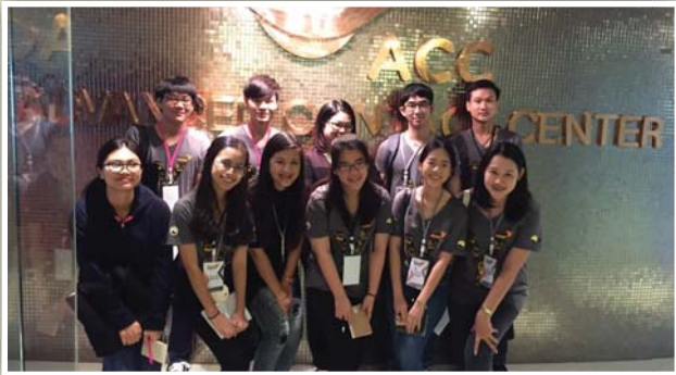
บริษัท แอดวานซ์ อินโฟร์ เซอร์วิส จำกัด (มหาชน)