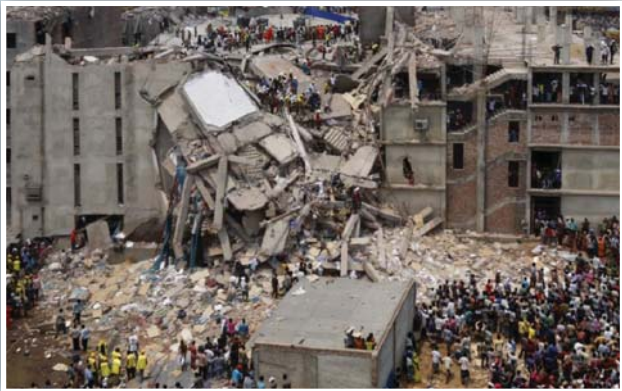
เมื่อเดือน เม.ย. 2556 ตึกของโรงงานรับตัดเย็บเสื้อผ้าชื่อ Rana Plaza ถล่มที่บังกลาเทศ เป็นผลให้พนักงานซึ่งส่วนใหญ่เป็นสุภาพสตรีเสียชีวิตกว่าหนึ่งพันคน และต่อมาเจ้าหน้าที่พบว่าสภาพการทำงานต่ำกว่ามาตรฐานมาก

เมื่อเดือนเมษายน 2556 กรณีนี้ได้สร้างความตื่นตัวให้กับอุตสาหกรรมเสื้อผ้าสำเร็จรูปทั่วโลกในการที่จะตรวจสอบห่วงโซ่อุปทานของตนเองอย่างจริงจัง เพราะปรากฏว่าโรงงานรานา พลาซ่า นี้กำลังผลิตเสื้อผ้าสำหรับยี่ห้อต่างๆ ทั้งในยุโรปและสหรัฐฯ