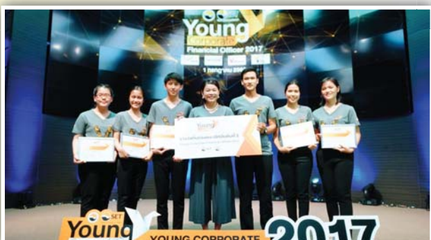
รางวัลชมเชย