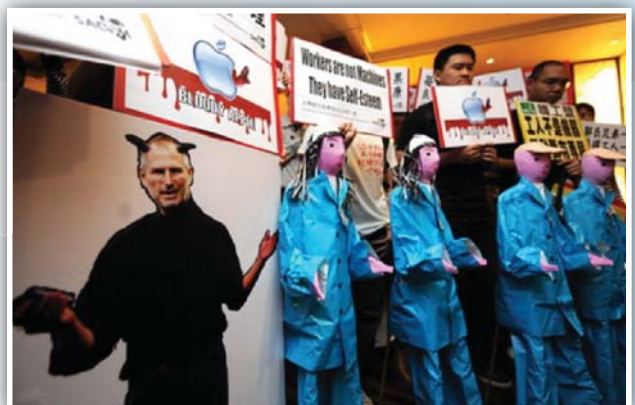
แอปเปิลเลือก ผู้ประท้วงนำหุ่นรูปคนงาน Foxconn ที่ฆ่าตัวตายประท้วงเรียกร้องสิทธิแรงงาน ระหว่างการประชุมประจำปีของบริษัทฯ ในฮ่องกง เมื่อเดือน มิ.ย. 2553

ดังกรณีบริษัทแอปเปิล ผู้ผลิต iPhone เองก็ไม่พ้นที่จะตกเป็นจำเลย เมื่อฟอกซ์คอนน์ เทคโนโลยี กรุ๊ป (Foxconn Technology Group) ซึ่งเป็นบริษัทผู้ผลิตสินค้าตามสัญญา (outsourc) รายใหญ่ที่สุดในโลก ผลิตชิ้นส่วนคอมพิวเตอร์และเป็นผู้ประกอบผลิตภัณฑ์จำพวก iPhone และ iPad ให้กับบริษัทแอปเปิล นอกจากแอปเปิลแล้ว ลูกค้ารายใหญ่ของฟอกซ์คอนน์ ล้วนเป็นบริษัทผลิตคอมพิวเตอร์ข้ามชาติในสหรัฐฯ ฟอกซ์คอนน์ มีโรงงานหลายแห่งในมณฑลต่างๆ มีคนงานรวมกัน ทั้งสิ้นราว 1.2 ล้านคน เมื่อเดือนกันยายน 2555 เกิดเหตุจลาจลในโรงงานแห่งหนึ่งในเครือฟอกซ์คอนน์ ที่ผลิต iPhone 5 ซึ่งเพิ่งวางจำหน่ายทั่วโลกไม่กี่วันก่อนหน้านั้น การประท้วงครั้งนั้น ซึ่งดูเหมือนการวิวาทของพนักงานโรงงานทั่วไป ไม่ได้ยุติได้ง่าย แต่กลับนำไปสู่การสืบค้นเกี่ยวกับมาตรฐาน ด้านแรงงานของฟอกซ์คอนน์ โดยส่วนหนึ่งของรายงานโดย China Labour Bulletin ว่า “การทำงานใน