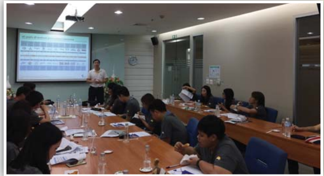
บริษัท ไทยยูเนี่ยน กรุ๊ป จำกัด (มหาชน)