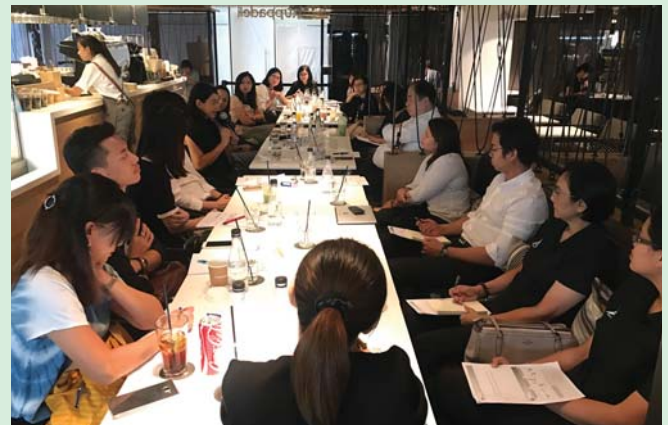
กิจกรรม IR Refresh Course 1/2560 หัวข้อ "Attending board meeting : what should IR report?"