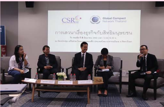
CSR Club และ Global Compact Network Thailand ร่วมจัดบรรยายและเสวนา "เรื่องธุรกิจกับสิทธิมนุษยชน"