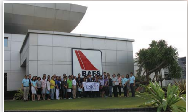
ครั้งที่ 2 กิจกรรมศึกษาดูงานด้านความยั่งยืน บมจ.บริการเชื้อเพลิงการบินกรุงเทพ Sustainable Development Knowledge Sharing หัวข้อ “การบริหารจัดการเพื่อการพัฒนาอย่างยั่งยืน” เมื่อวันที่ 7 ตุลาคม 2559 ณ สถานีบริการจัดเก็บน้ำมันอากาศยาน สุวรรณภูมิ จ.สมุทรปราการ