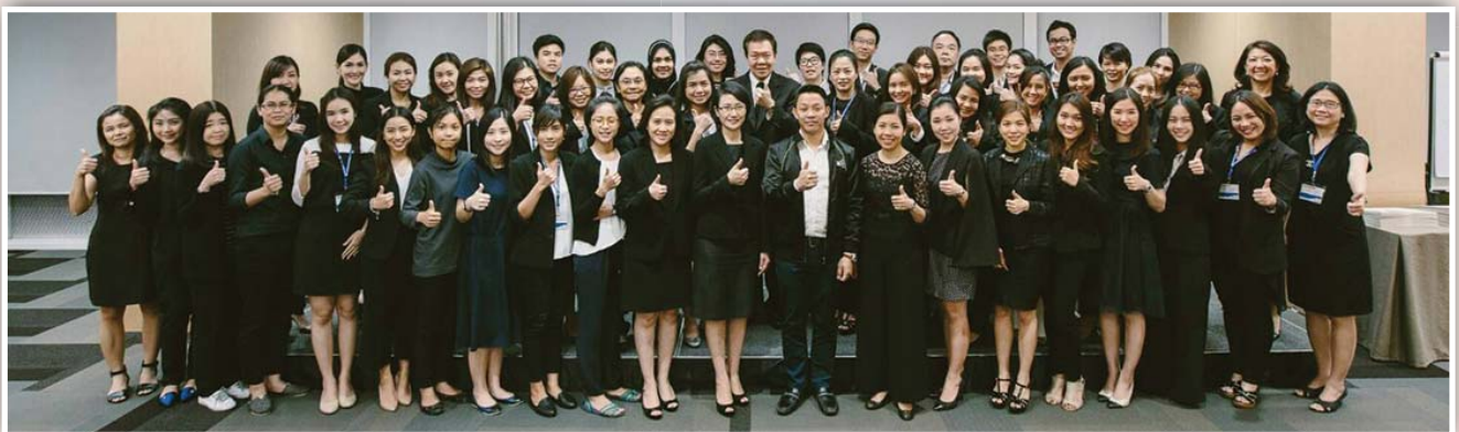
จัดหลักสูตร IR Professional Development Program “Certificate in Investor Relations 2016” เมื่อวันที่ 26 – 28 ตุลาคม 2559 ณ Victor Club อาคาร FYI Center