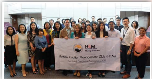
HCM Club Company Visit ครั้งที่ 1/2559 บริษัท แอดวานซ์ คอนแท็ค เซ็นเตอร์ จำกัด และรับฟังบรรยายในหัวข้อ “Key challenges in building people in the digital transformation era?” เมื่อวันที่ 25 กรกฎาคม 2559 ณ อาคาร AIS TOWER 1 ถนนพหลโยธิน

เพื่อเป็นการส่งเสริมผลักดันให้บริษัทตระหนักถึงความสำคัญของการสร้างวัฒนธรรมแห่งการเรียนรู้และเป็นเวทีในการแลกเปลี่ยนเรียนรู้ ด้าน Human Capital Management ระหว่างบริษัทจดทะเบียนด้วยกัน