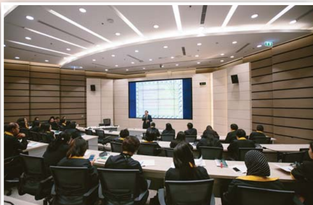
รับฟังการบรรยาย เรื่อง “ข้อคิดในการบริหารจัดการโรงเรียน” โดย ดร.ชัยวัฒน์ วิบูลย์สวัสดิ์ ประธานกรรมการ ตลาดหลักทรัพย์แห่งประเทศไทย ณ อาคารตลาดหลักทรัพย์แห่งประเทศไทย