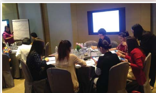
จัดหลักสูตรผู้ปฏิบัติงานเลขานุการบริษัท (หลักสูตร 4 วัน) รุ่นที่ 1/2559 เมื่อวันที่ 21 - 22 , 26 - 27 กรกฎาคม 2559 ณ โรงแรมเจดับบลิว แมริออท