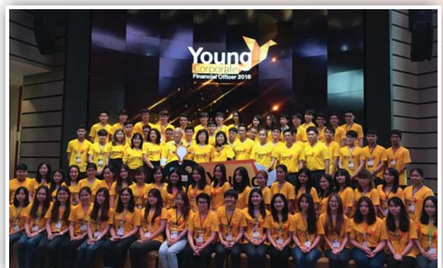
จัดโครงการ Young Corporate Financial Officer 2016 เมื่อวันที่ 23 มิถุนายน - 2 กรกฎาคม 2559 ณ อาคารตลาดหลักทรัพย์แห่งประเทศไทย