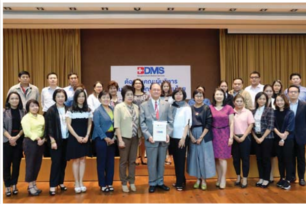
HCM Club Company Visit ครั้งที่ 3/2559 บมจ.กรุงเทพดุสิตเวชการ (โรงพยาบาลกรุงเทพ) และรับฟังบรรยายในหัวข้อ “How to build culture of excellence?” เมื่อวันที่ 29 สิงหาคม 2559 ณ โรงพยาบาลกรุงเทพ