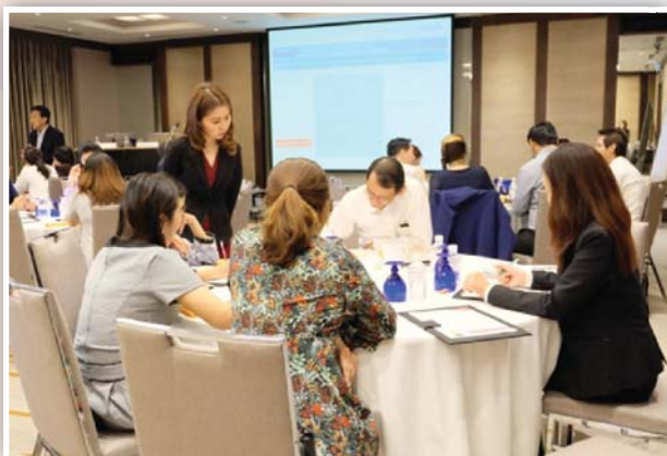
จัดหลักสูตร Enterprise Risk Management in Practice ครั้งที่ 1 เมื่อวันที่ 8 มิถุนายน 2559 ณ โรงแรมคราวน์ พลาซ่า ลุมพินี พาร์ค