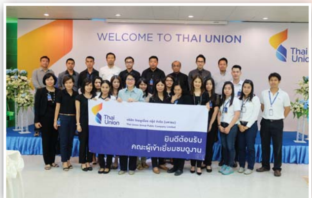
ครั้งที่ 3 กิจกรรมศึกษาดูงานด้านความยั่งยืน บมจ.ไทยยูเนียน กรุ๊ป Sustainable Development Knowledge Sharing หัวข้อ “การบริหารจัดการเพื่อการพัฒนาที่ยั่งยืน” เมื่อวันที่ 28 พฤศจิกายน 2559 ณ โรงงานสมุทรสาคร จ.สมุทรสาคร