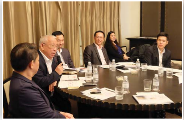
จัดงานสัมมนาร่วมกับบริษัท เอออน ฮิววิท (ประเทศไทย) จำกัด ในหัวข้อ “Managing Your Family Business Succession Management Professionally” เมื่อวันที่ 7 ตุลาคม 2559 ณ โรงแรม แกรนด์ ไฮแอท เอราวัณ