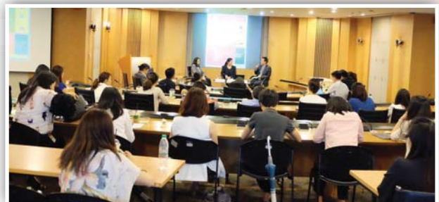
IR Workshop ครั้งที่ 1/2559 หัวข้อ “Investor relations in the storm-What are the communication strategy?” เมื่อวันที่ 23 พฤษภาคม 2559 ณ อาคารตลาดหลักทรัพย์แห่งประเทศไทย