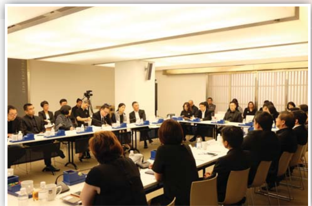
จัดงาน HR Pain Point Forum ในหัวข้อ “Managing HR Big Data for Strategic Decisions” เมื่อวันที่ 1 ธันวาคม 2559 ณ โรงแรมแกรนด์ ไฮแอท เอราวัณ