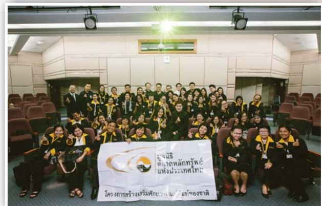
รับฟังการถ่ายทอดประสบการณ์อาชีพที่น่าสนใจของคนรุ่นใหม่ ยุคดิจิทัลและเยี่ยมชมคอลเซนเตอร์ บริษัท แอดวานซ์ อินโฟร์ เซอร์วิส จำกัด (มหาชน)