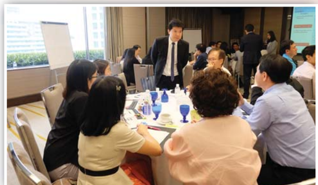
จัดหลักสูตร Enterprise Risk Management in Practice ครั้งที่ 2 เมื่อวันที่ 11 ตุลาคม 2559 ณ โรงแรมคราวน์ พลาซ่า ลุมพินี พาร์ค