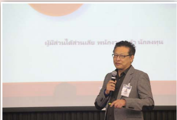
จัดงาน Experiences Sharing of CAC Certification Process เมื่อวันที่ 9 กันยายน 2559 ณ สถาบันวิทยาการตลาดทุน นอร์ธพาร์ค

สมาคมบริษัทจดทะเบียนไทยในฐานะผู้ร่วมก่อตั้ง CAC จึงร่วมกับสถาบันกรรมการบริษัทไทย (IOD) ในฐานะเลขานุการโครงการฯ จัดสัมมนาให้ความรู้เกี่ยวกับโครงการ CAC แก่บริษัทจดทะเบียน เพื่อให้มีความรู้ความเข้าใจเกี่ยวกับการประเมินความเสี่ยงด้านคอร์รัปชัน และเรื่องอื่นๆ ที่เกี่ยวข้องกับกระบวนการรับรองของโครงการ