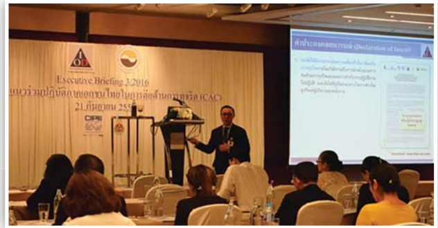
จัดงาน Executive Briefing 3/2016 : โครงการ CAC เมื่อวันที่ 21 กันยายน 2559 ณ โรงแรมเซ็นทารา แกรนด์ แอท เซ็นทรัลเวิลด์