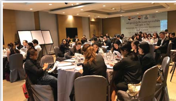
จัดหลักสูตรผู้ปฏิบัติงานเลขานุการบริษัท (หลักสูตร 4 วัน) รุ่นที่ 2/2559 เมื่อวันที่ 23 - 24 , 29 - 30 พฤศจิกายน 2559 ณ โรงแรมเจดับบลิว แมริออท