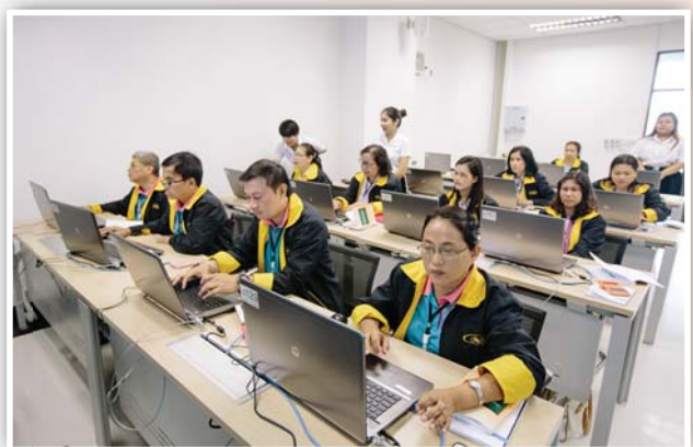
ศึกษาดูงานเกี่ยวกับนวัตกรรมทางการศึกษา และอบรมเชิงปฏิบัติการในการใช้ Google Application ณ มหาวิทยาลัยเกษตรศาสตร์ บางเขน