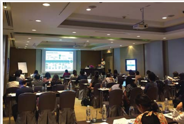
จัดหลักสูตรพื้นฐานเลขานุการบริษัท (หลักสูตร 3 วัน) รุ่นที่ 2/2559 เมื่อวันที่ 17 - 19 ตุลาคม 2559 ณ โรงแรมเจดับบลิว แมริออท