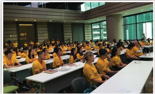
IR Workshop ครั้งที่ 2/2559 หัวข้อ "How to improve your IR strategy from basic to advanced?" เมื่อวันที่ 2 กันยายน 2559 ณ อาคารตลาดหลักทรัพย์แห่งประเทศไทย