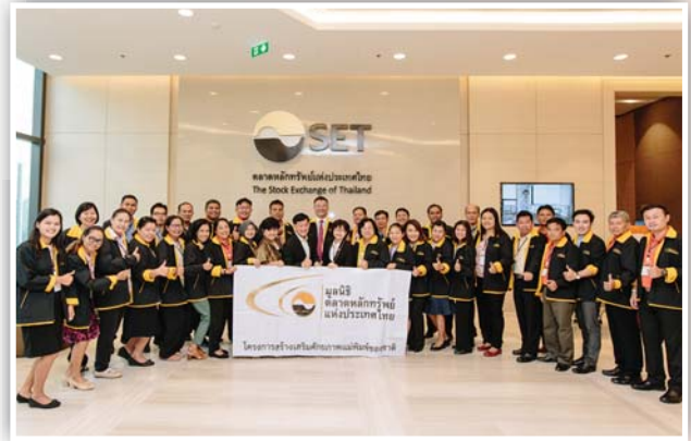
พิธีเปิดโครงการสร้างเสริมศักยภาพแม่พิมพ์ของชาติ รุ่นที่ 8 พร้อมเยี่ยมชมพิพิธภัณฑ์เรียนรู้การลงทุน Investory และห้องสมุดมารวย ณ อาคารตลาดหลักทรัพย์แห่งประเทศไทย