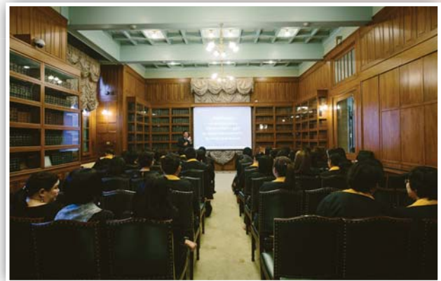
รับฟังการบรรยาย บทบาทและหน้าที่ของธนาคารแห่งประเทศไทย และเยี่ยมชมพิพิธภัณฑ์ธนาคารแห่งประเทศไทย