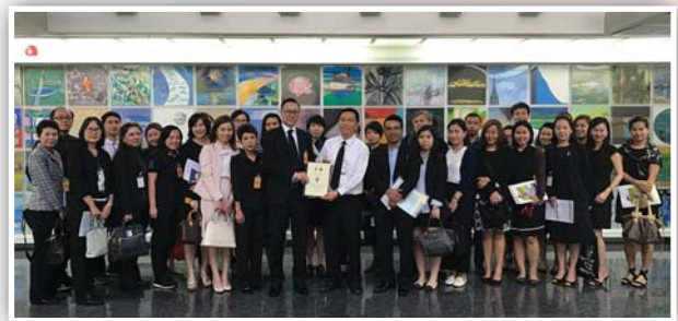
จัดโครงการ CAC Company Visit ศึกษาดูงานด้านการต่อต้านทุจริตคอร์รัปชัน กลุ่มทีสโก้ เมื่อวันที่ 20 ธันวาคม 2559 ณ ทีสโก้ทาวเวอร์