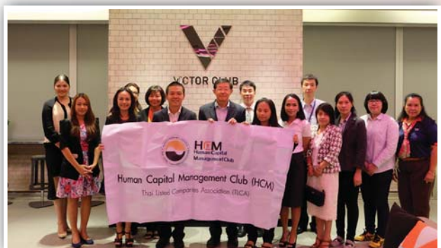
HCM Club Company Visit ครั้งที่ 2/2559 บมจ.แผ่นดินทอง พร็อพเพอร์ตี้ ดีเวลลอปเม้นท์ และรับฟังบรรยายในหัวข้อ “Challenges in building corporate culture for employee engagement” เมื่อวันที่ 26 สิงหาคม 2559 ณ อาคารสาทร สแควร์ ถนนสาทรเหนือ