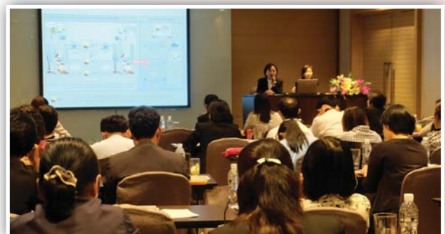
จัดหลักสูตรพื้นฐานเลขานุการบริษัท (หลักสูตร 3 วัน) รุ่นที่ 1/2559 เมื่อวันที่ 20 - 22 มิถุนายน 2559 ณ โรงแรมเจดับบลิว แมริออท