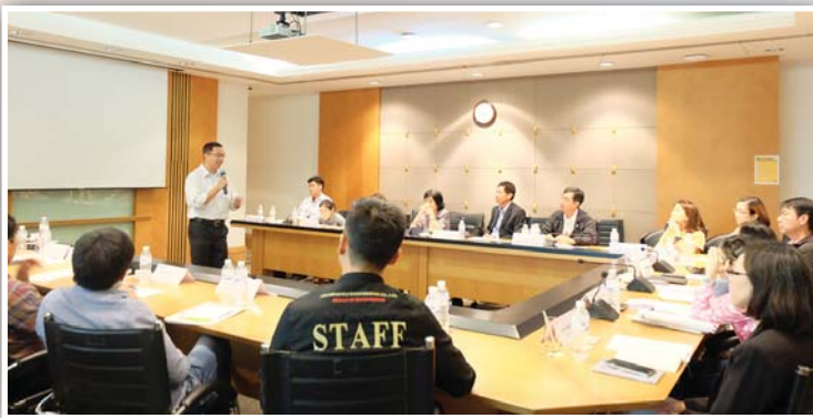
- Business workshop & Company visits -

ในเดือนมีนาคม ศูนย์ฯ ได้แต่งตั้งที่ปรึกษาประจำบริษัท ทั้ง 14 บริษัท บริษัทละ 2 ท่าน โดยพิจารณาจากประเด็นความท้าทายหลักของบริษัทเป็นหลัก และตั้งแต่เดือนเมษายน 2559 ที่ปรึกษาประจำบริษัท เริ่มเข้าไปคำปรึกษาแนะนำแก่บริษัทที่เข้าร่วมโครงการ โดยในครั้งแรกจะเป็นการจัดประชุมที่โรงงาน/บริษัท และมีการจัดประชุมเพื่อติดตามการดำเนินงานเป็นระยะตามความเหมาะสมจนถึงสิ้นปี 2559