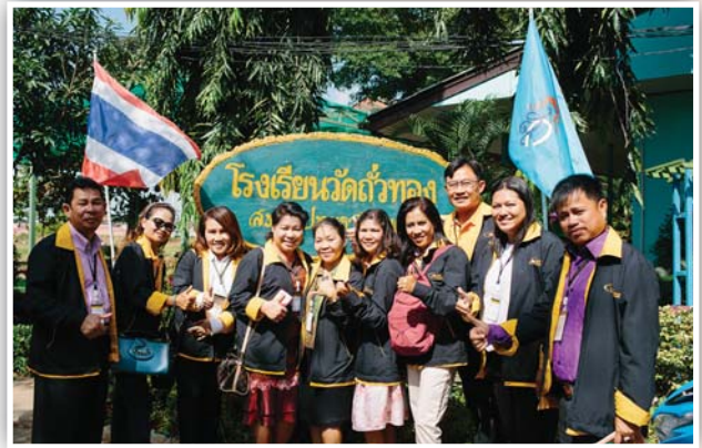
เยี่ยมชมโรงเรียนวัดถั่วทอง จ.ปทุมธานี ซึ่งเป็นโรงเรียนขนาดเล็ก ที่ถูกนำท่วมและประสบปัญหาการถูกยุบโรงเรียน จนพัฒนาเป็นโรงเรียนดีเด่น