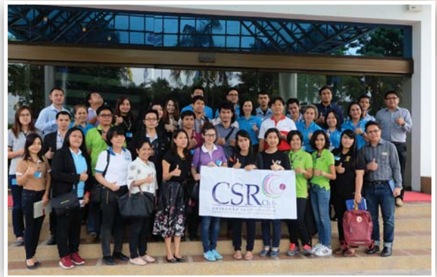
ครั้งที่ 1 กิจกรรมศึกษาดูงานด้านความยั่งยืน บมจ. เอลต้า อิเล็กทรอนิกส์ (ประเทศไทย) Sustainable Development Knowledge Sharing หัวข้อ “การบริหารจัดการและพลังงานสะอาดที่ยั่งยืน” เมื่อวันที่ 5 สิงหาคม 2559 ณ นิคมอุตสาหกรรมบางปู จ.สมุทรปราการ