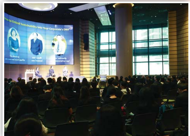
จัดพิธีมอบรางวัล “รายงานความยั่งยืน ประจำปี 2559” (Sustainability Report Award 2016) เมื่อวันที่ 15 ธันวาคม 2559 ณ หอประชุมศุภกรีย์ แก้วเจริญ ชั้น 3 อาคารตลาดหลักทรัพย์แห่งประเทศไทย