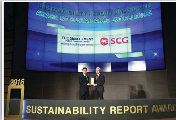
รางวัล AWARD OF SUSTAINABLE EXCELLENCE บริษัท ปูนซิเมนต์ไทย จำกัด (มหาชน)