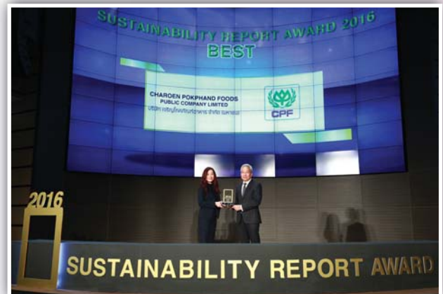
รางวัล รายงานความยั่งยืน รางวัล “ดีเยี่ยม” บริษัท เจริญโภคภัณฑ์อาหาร จำกัด (มหาชน)