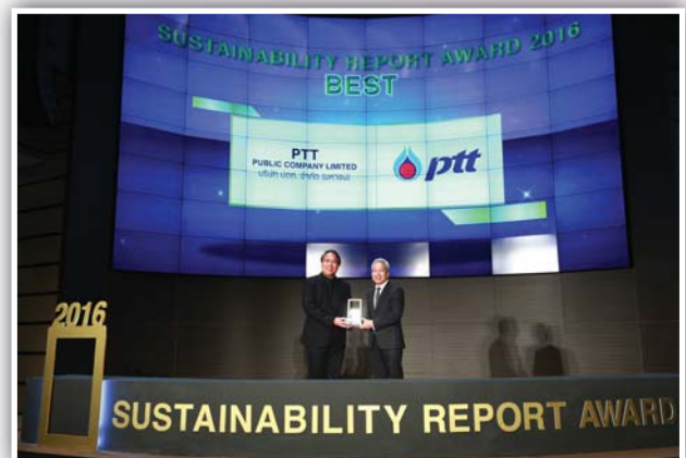
รางวัล รายงานความยั่งยืน รางวัล “ดีเยี่ยม” บริษัท ปตท จำกัด (มหาชน)