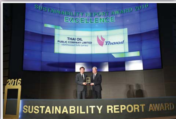
รางวัล รายงานความยั่งยืน รางวัล “ยอดเยี่ยม” บริษัท ไทยออยล์ จำกัด (มหาชน)