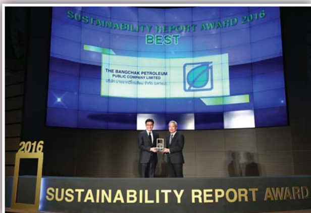
รางวัล รายงานความยั่งยืน รางวัล “ดีเยี่ยม” บริษัท บางจากปิโตรเลียม จำกัด (มหาชน)