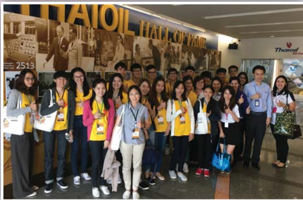
เข้าศึกษาดูงานและรับฟังบรรยายข้อมูล บมจ. ไทยออยล์

บริษัทจดทะเบียนที่ร่วมเป็นกรณีศึกษาในการแข่งขัน Company Roadshow Competition ได้แก่ บมจ. ไทยออยล์ บมจ. บีทีเอส กรุ๊ป โฮลดิ้งส์ บมจ. ไมเนอร์ อินเตอร์เนชั่นแนล และบมจ. แม็ค กรุ๊ป ซึ่งก่อนการแข่งขันในวันสุดท้ายทุกบริษัทได้ร่วมเป็นที่ปรึกษาถ่ายทอดประสบการณ์ และองค์ความรู้ พร้อมกับการแนะนำการจัดเตรียมและการนำเสนอข้อมูล ของบริษัทให้กับนักศึกษาที่เข้าโครงการ ตลอดจนข้อเสนอแนะในการเป็นนักลงทุนสัมพันธ์ที่ดีให้กับนักศึกษาในโครงการอีกด้วย