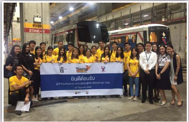
เข้าศึกษาดูงานและรับฟังบรรยายข้อมูล บมจ. บีทีเอส กรุ๊ป โฮลดิ้งส์