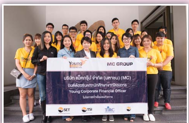
เข้าศึกษาดูงานและรับฟังบรรยายข้อมูล บมจ. แม็คกรุ๊ป

สมาคมบริษัทจดทะเบียนไทย ขอขอบคุณตลาดหลักทรัพย์แห่งประเทศไทย วิทยากร คณะกรรมการตัดสิน Company Roadshow บริษัทจดทะเบียนที่ร่วมเป็น case study บริษัทจดทะเบียนที่ตอบรับนักศึกษาเข้าร่วมฝึกงานและผู้เกี่ยวข้องที่ร่วมผลักดันให้โครงการดังกล่าวประสบความสำเร็จ