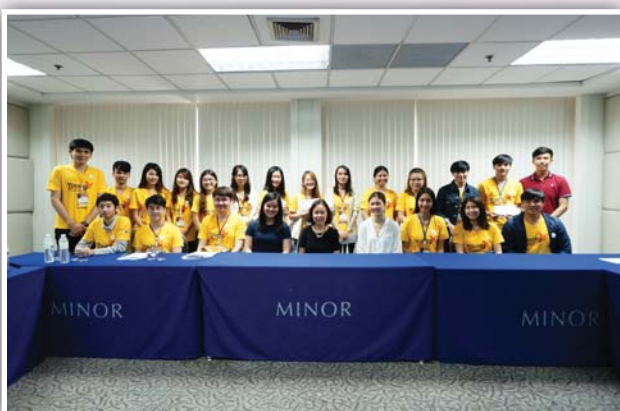
เข้าศึกษาดูงานและรับฟังบรรยายข้อมูล บมจ. ไมเนอร์ อินเตอร์เนชั่นแนล