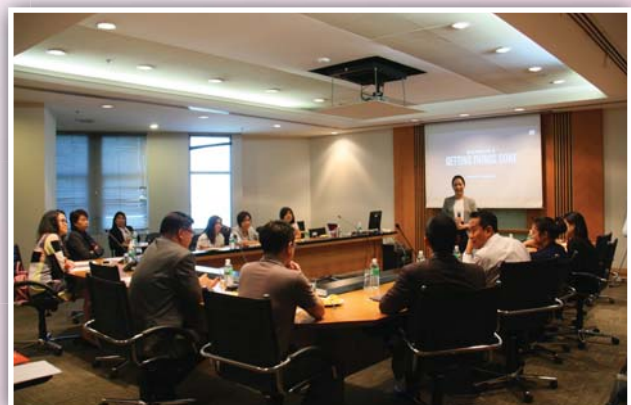
3 กรกฎาคม 2558 จัดงาน “Getting Things Done (GTD) Workshop”

HCM Club สมาคมบริษัทจดทะเบียนไทย ร่วมกับ RBL Group จัด Workshop "Delivering strategic HR and results for your business" เพื่อสร้างให้ผู้เข้าร่วมสัมมนาได้เข้าใจถึงแนวคิดหลักของการบริหารงานบุคคลที่เรียกว่า Outside-in คือการรับทราบข้อมูลที่แท้จริงจากลูกค้าที่มีต่อองค์กรในมุมมองของลูกค้า