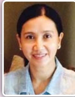
ประธานชมรม คุณภัทรพร มิลินทสูต ประธานเจ้าหน้าที่กำกับดูแลกิจการ บมจ. ธนาคารเกียรตินาคิน