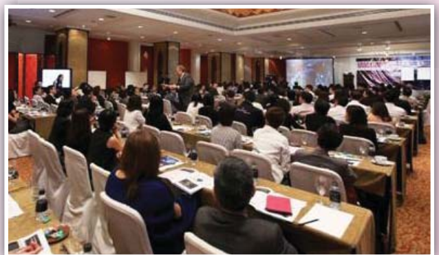
18 พฤศจิกายน 2558 จัดงาน LEADERSHIP WORKSHOP โดยมี Professor Dave Ulrich เป็นวิทยากร