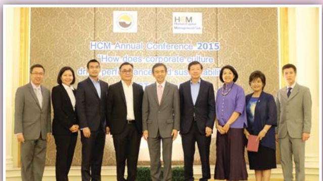
22 ตุลาคม 2558 จัดงาน HCM Annual Conference 2015