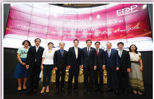
8 กันยายน 2558 แถลงข่าวความร่วมมือของสมาคมฯ กับ International Partners ในการจัดหลักสูตร TLCA Executive Development Program ได้แก่ กลุ่มเคพีเอ็มจี ภูมิภาคเอเชีย และธนาคารกรุงเทพ จำกัด (มหาชน)