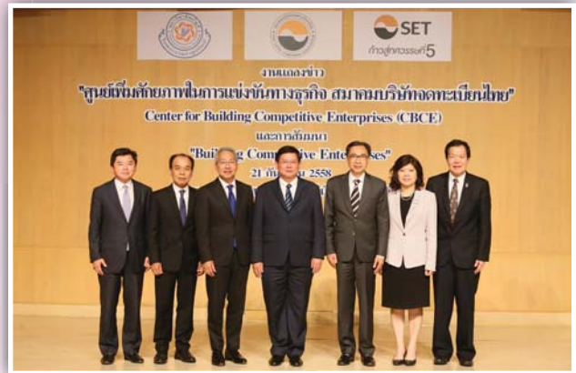
21 กันยายน 2558 งานแถลงข่าวเปิดตัว ศูนย์เพิ่มศักยภาพในการแข่งขันทางธุรกิจ (Center for Building Competitive Enterprises: CBCE)

- การแต่งตั้ง International Partner ได้แก่ กลุ่มเคพีเอ็มจี ภูมิภาคเอเชีย และธนาคารกรุงเทพ จำกัด (มหาชน) เพื่อร่วมเป็นพันธมิตรในการจัดกิจกรรมศึกษาดูงานในกลุ่มประเทศ CLMV