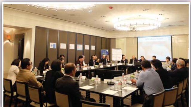
22 กรกฎาคม 2558 จัดงาน HCM Roundtable Discussion ครั้งที่ 1/2558

HCM Club สมาคมบริษัทจดทะเบียนไทย จัดงาน HCM Roundtable Discussion ในหัวข้อ “How does corporate culture drive performance and sustain- ability?” เพื่อจัดให้ผู้บริหารระดับสูงของบริษัทจดทะเบียน ร่วมเสวนาแลกเปลี่ยนความคิดเห็นและประสบการณ์ใน เรื่องของการสร้างวัฒนธรรมองค์กร