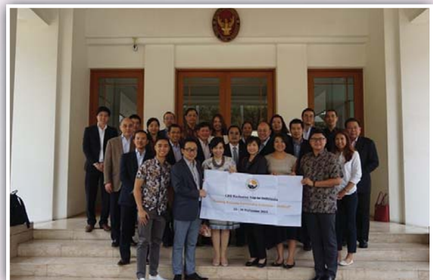
23 - 26 กันยายน 2558 จัดกิจกรรม CEO Exclusive Trip to Indonesia - “Building Business Partnership Indonesia – Thailand”