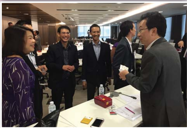
17 มีนาคม 2558 จัด IR Club Networking ในหัวข้อ “Evolving IR Best Practices for Targeting, Attracting & Retaining Global Investors”

Workshop เพื่อเตรียมรับมือกับการเปลี่ยนแปลงที่สำคัญของงาน IR พร้อมขอรับคำปรึกษาหรือรับคำแนะนำเกี่ยวกับประเด็นต่างๆ และแลกเปลี่ยนความเห็นอย่างใกล้ชิดกับคณะกรรมการชมรมฯ ซึ่งเป็นผู้ที่มีประสบการณ์ด้านนักลงทุนสัมพันธ์