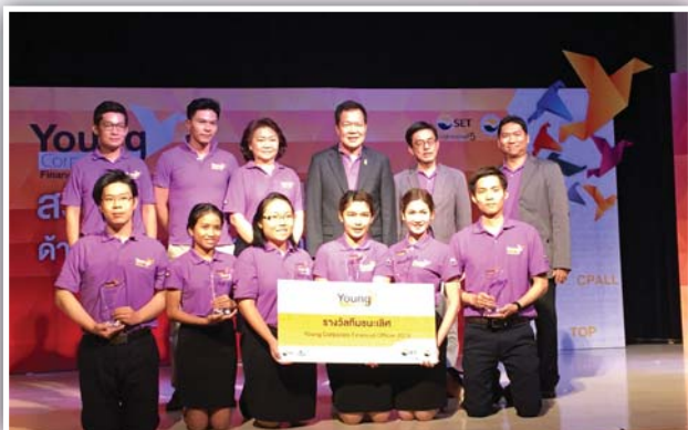
19 - 28 มิถุนายน 2558 จัดโครงการ Young CFO-Corporate Financial Officer 2015