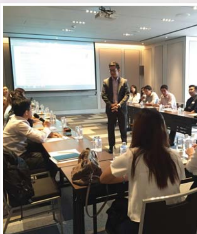
17 กรกฎาคม 2558 จัดกิจกรรม IR Workshop ครั้งที่ 2/2558 หัวข้อ “How mid-small caps overcome the changes of sparking investor interest, securing analyst coverage and maintaining liquidity?”