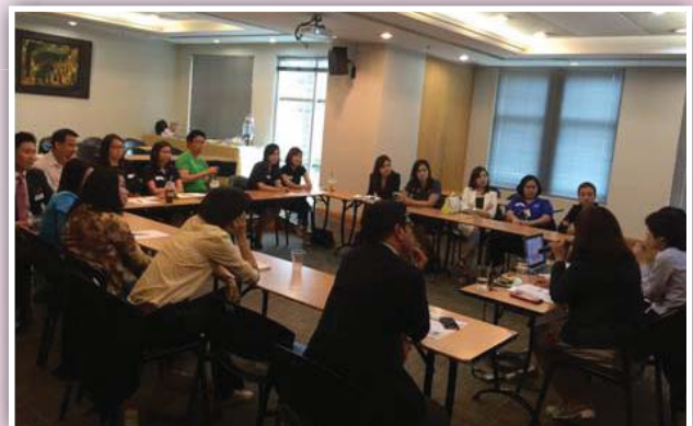
22 ตุลาคม 2558 จัดงาน TLCA IR & CS Networking การเตรียมความพร้อมสำหรับการจัดประชุม AGM ปี 2559