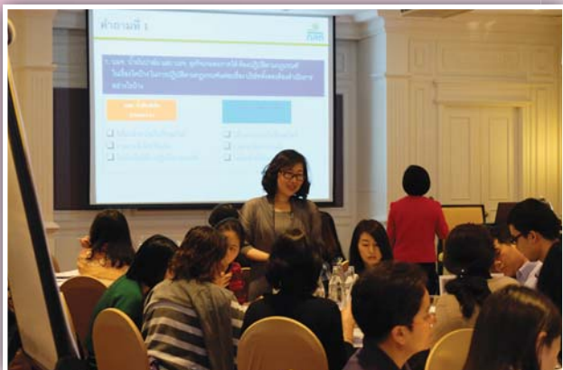
7 - 8 และ 15 - 16 กรกฎาคม 2558 จัดหลักสูตรปฏิบัติการงานเลขานุการบริษัท Advances for Corporate Secretaries รุ่นที่ 1/2558