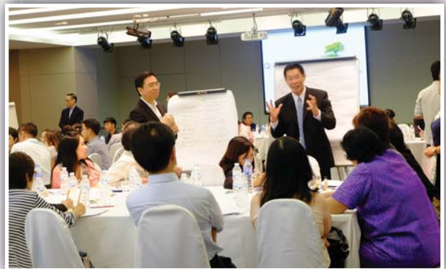
24 และ 31 สิงหาคม 2558 จัด Workshop การเตรียมความพร้อมเข้าโครงการแนวร่วมปฏิบัติของภาคเอกชนไทยในการต่อต้านการทุจริต (CAC)

• ส่งเสริมบริษัทสมาชิก เน้นบริษัทที่ไม่ได้อยู่ใน SET 100 ถึงแนวทางในการให้ความช่วยเหลือและสนับสนุนการเข้าร่วมโครงการ CAC