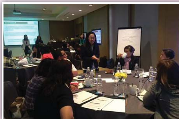
11 - 12 และ 18 - 19 พฤศจิกายน 2558 จัดหลักสูตรปฏิบัติการงานเลขานุการบริษัท Advances for Corporate Secretaries รุ่นที่ 2/2558