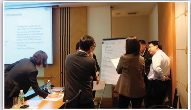
22 กันยายน 2558 จัดงาน HCM Workshop “Delivering strategic HR and results for your business”