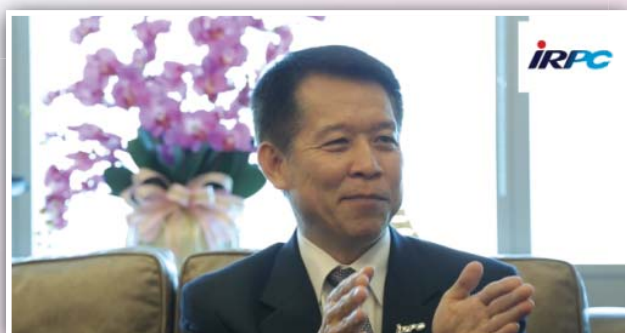
จัดทำ CEO Video Clip บทสัมภาษณ์ผู้บริหารเพื่อใช้ประกอบการจัดกิจกรรมของชมรมฯ

สนับสนุนให้เกิดการแลกเปลี่ยนข้อมูล ความรู้ และประสบการณ์จาก HR Professional ต่างประเทศ