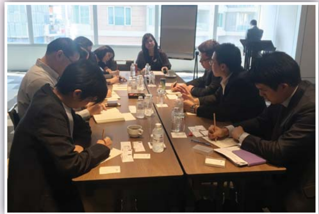
30 มีนาคม 2558 จัดกิจกรรม IR Workshop ครั้งที่ 1/2558 หัวข้อ “CEO in IR role and his key challenges”