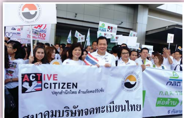
6 กันยายน 2558 ร่วมแสดงพลังในงานวันต่อต้านคอร์รัปชัน ภายใต้แนวคิด “ACTIVE CITIZEN พลังพลเมือง...ต่อต้านคอร์รัปชัน”