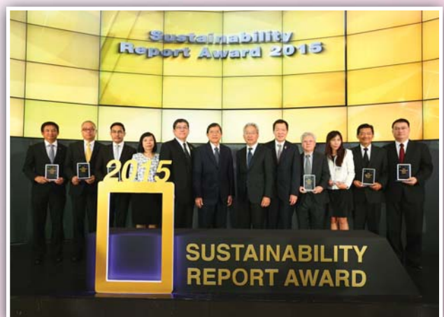
15 ธันวาคม 2558 จัดพิธีมอบรางวัล “รายงานความยั่งยืนประจำปี 2558” (Sustainability Report Award 2015)