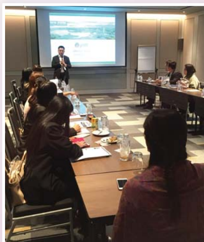
21 กันยายน 2558 จัด IR Workshop ครั้งที่ 3/2558 หัวข้อ “MD&A Best Practice – Learn from the Pros”