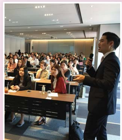
23 พฤศจิกายน 2558 จัด IR Workshop ครั้งที่ 4/2558 ในหัวข้อ “Simplifying the IR message”