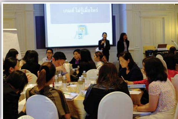
7 - 9 ตุลาคม 2558 จัดหลักสูตรพื้นฐานเลขานุการบริษัท (หลักสูตร 3 วัน) Fundamentals Practice for Corporate Secretaries รุ่นที่ 2/2558

ชมรมเลขานุการบริษัทไทย สมาคมบริษัทจดทะเบียนไทย ร่วมกับตลาดหลักทรัพย์แห่งประเทศไทย สำนักงานคณะกรรมการ ก.ล.ต. จัดหลักสูตรผู้ปฏิบัติงานเลขานุการบริษัท Advances for Corporate Secretaries เพื่อพัฒนาความรู้ในการปฏิบัติงานเลขานุการบริษัท เน้นแนวทางในการปฏิบัติงานที่ควรทราบและสามารถนำไปใช้ปฏิบัติงาน มุ่งเน้นทักษะในด้านต่างๆ ที่เลขานุการบริษัทพึงมี รวมถึงเรียนรู้บทบาทหน้าที่ ความรับผิดชอบของเลขานุการบริษัท จากกรณีศึกษาที่เกิดขึ้นจริงในบริษัทจดทะเบียน