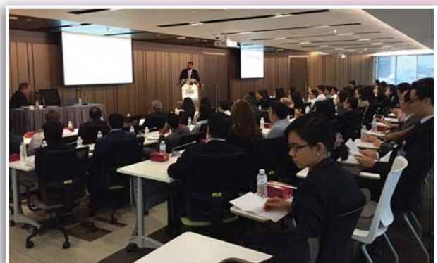
ผู้บริหารและผู้บริหารงานด้านนักลงทุนสัมพันธ์สนใจเข้าร่วมกิจกรรม IR Networking ครั้งที่ 1/2558 กว่า 50 ท่าน