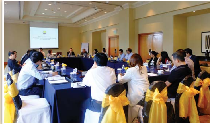
แลกเปลี่ยนประสบการณ์ในการลงทุนในสาธารณรัฐสังคมนิยมเวียดนาม โดย บมจ.ชาบีน่า และ บมจ.ไพรม์ต้า จิวเวลรี่