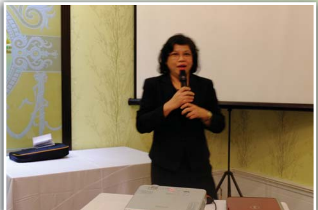
คุณมาลินี หาญบุญทรง กงสุลพามิซซ์ ณ นครโฮจิมินห์ ให้ข้อเสนอแนะเพิ่มเติมในการลงทุนในประเทศเวียดนาม