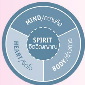
กรอบความคิดของบุคคลแบบองค์รวม (Whole-Person Paradigm)

ผู้นำที่เป็นเลิศมีแนวคิด ทักษะ และเครื่องมือที่สำคัญในการสร้างศรัทธาให้เกิดขึ้นในการทำงานร่วมกับผู้อื่น สร้างความสอดคล้องของเป้าหมายการดำเนินงานกับระบบงาน และสามารถปลดปล่อยศักยภาพของบุคลากรออกมาอย่างสูงสุด เพื่อบรรลุเป้าหมายที่สำคัญยิ่งขององค์กร สิ่งเหล่านี้รวมอยู่ใน “กรอบความคิดของบุคคลแบบองค์รวม” และ “ภารกิจหลัก 4 ประการของผู้นำที่เป็นเลิศ”