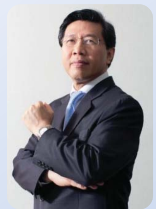
ดร.วสวล ไสค์ติยานุรักษ์

“ก.ล.ต. ให้ความสำคัญกับเป้าหมายการพัฒนาอย่างยั่งยืนของตลาดทุนไทย โครงการประกาศรางวัลรายงานความยั่งยืนจะเป็นการกระตุ้นและส่งเสริมให้บริษัทจดทะเบียนมีการทำ CSR ในกระบวนการธุรกิจหรือ CSR-in-process ซึ่งสอดคล้องกับแนวทางที่ ก.ล.ต. มุ่งหวังให้บริษัทจดทะเบียนและบริษัทที่ออกหลักทรัพย์ผสานเรื่อง CSR เข้าไปในกลยุทธ์องค์กร และเป็นส่วนหนึ่งในการดำเนินธุรกิจของบริษัท รวมถึงเปิดเผยข้อมูลการดำเนินงานด้าน CSR ในรายงานประจำปีและในแบบ 56-1 หรือแสดงรายการ