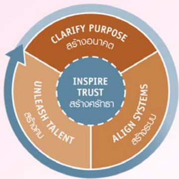
ภารกิจหลัก 4 ประการของผู้นำที่เป็นเลิศ (The 4 Imperatives of Great Leaders)

สร้างศรัทธาเป็นภารกิจแรกและเป็นภารกิจที่สำคัญที่สุดของผู้นำที่เป็นเลิศ ผู้นำทั่วไปมักพูดว่า “ฉันสั่งการได้เพราะฉันเป็นหัวหน้า” ผู้นำแบบนี้มีอำนาจในการสั่งให้ลูกน้องทำงานเพราะตำแหน่ง แต่แนวคิดของผู้นำที่เป็นเลิศคือ “ฉันทำให้ภารกิจสำเร็จลุล่วงได้ ด้วยแรงจูงใจและความน่าเชื่อถือส่วนตัว” ผู้นำที่เป็นเลิศใช้อำนาจที่ไม่ได้มาจากตำแหน่ง หรือเรียกว่า ศรัทธา ซึ่งจะเกิดได้เมื่อมี 4 องค์ประกอบสำคัญ คือ 1. ความซื่อตรง 2. เจตนาธรรม 3. ศักยภาพ และ 4. ผลลัพธ์