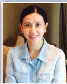
ประธานชมรมฯ

คุณกัทธสว มลิณทสุด ประธานเจ้าหน้าที่กำกับดูแลกิจการ บมจ. ธนาคารกสิกรไทย