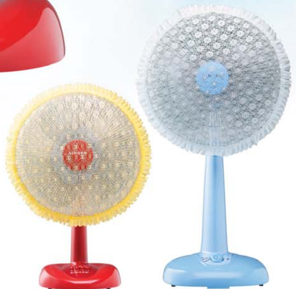
พัดลมตั้งโต๊ะ ขนาด 16 นิ้ว ราคา 1,200 บาท