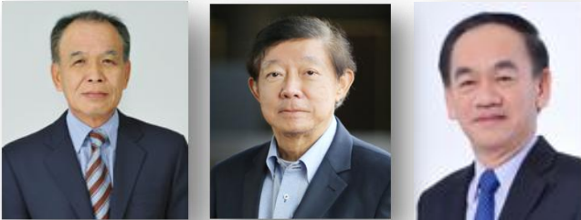
1 2 3