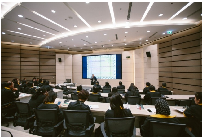
รับฟังการบรรยาย เรื่อง “ข้อคิดในการบริหารจัดการโรงเรียน” โดย ดร.ชัยวัฒน์ วิบูลย์สวัสดิ์ ประธานกรรมการ ตลาดหลักทรัพย์แห่งประเทศไทย ณ อาคารตลาดหลักทรัพย์แห่งประเทศไทย

โครงการสร้างเสริมศักยภาพแม่พิมพ์ของชาติ รุ่นที่ 9 ได้คัดเลือกคุณครูจากโรงเรียนที่เคยเข้าร่วมโครงการสานรัก หัวใจแกร่ง จำนวน 37 คน จาก 21 โรงเรียน เพื่อเปิดโอกาสให้คุณครูในโรงเรียนพื้นที่ห่างไกลของประเทศ ได้มีโอกาสเปิดโลกทัศน์ เข้ามาเรียนรู้สิ่งใหม่ๆ ทั้งในด้านสื่อการเรียนการสอนสมัยใหม่ สามารถนำความรู้ที่ได้รับไปปรับประยุกต์ใช้ในกิจกรรมการเรียนการสอนในโรงเรียน พร้อมสร้างให้เกิดการต่อยอดการพัฒนาในด้านต่างๆ ที่เป็นประโยชน์ต่อโรงเรียนและชุมชน รวมทั้งสร้างเครือข่ายความสัมพันธ์ของคุณครูที่เข้าร่วมโครงการภายหลังจบโครงการ