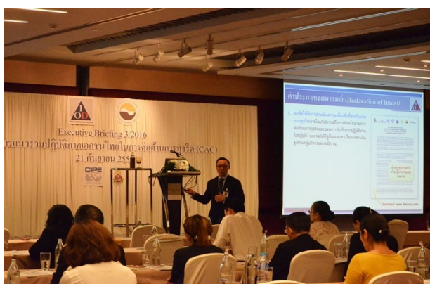
จัดงาน Executive Briefing 3/2016 : โครงการ CAC เมื่อวันที่ 21 กันยายน 2559 ณ โรงแรมเซ็นทารา แกรนด์ แอท เซ็นทรัลเวิลด์