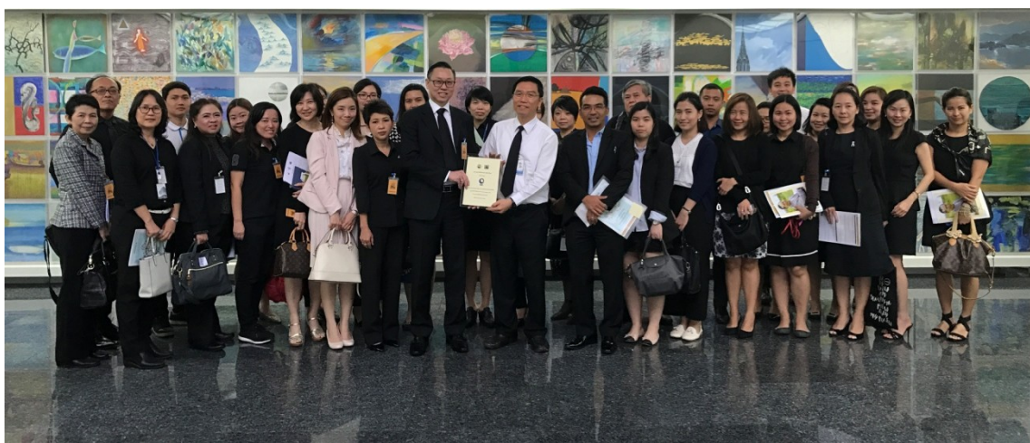
จัดโครงการ CAC Company Visit ศึกษาดูงานด้านการต่อต้านทุจริตคอร์รัปชัน กลุ่มทิสโก้ เมื่อวันที่ 20 ธันวาคม 2559 ณ ทิสโก้ทาวเวอร์