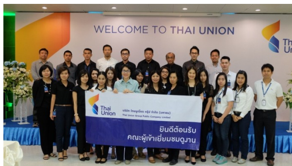
Company Visit ครั้งที่ 3 บมจ.ไทยยูเนี่ยน กรุ๊ป

ณ สถานีบริการจัดเก็บน้ำมันอากาศยาน สุวรรณภูมิ จ.สมุทรปราการ