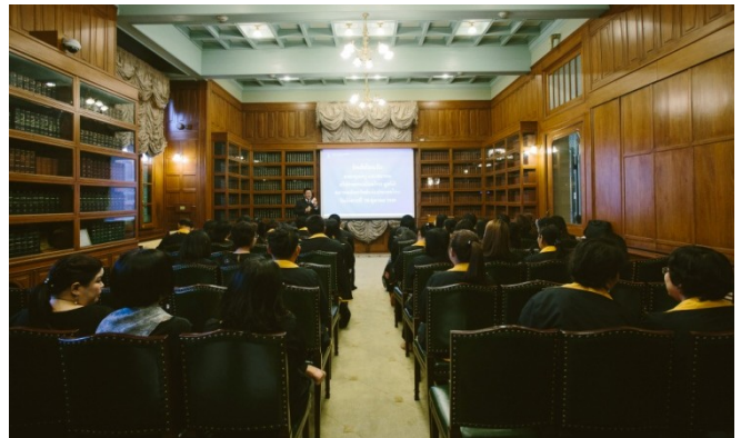
รับฟังการบรรยาย บทบาทและหน้าที่ของธนาคารแห่งประเทศไทย และเยี่ยมชมพิพิธภัณฑ์ธนาคารแห่งประเทศไทย