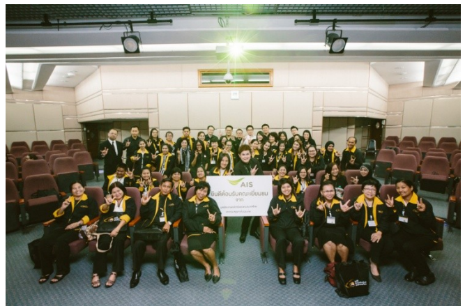
รับฟังการถ่ายทอดประสบการณ์อาชีพที่น่าสนใจของคนรุ่นใหม่ยุคดิจิทัล และเยี่ยมชมคอลเซ็นเตอร์ บริษัท แอดวานซ์ อินโฟร์ เซอร์วิส จำกัด (มหาชน)