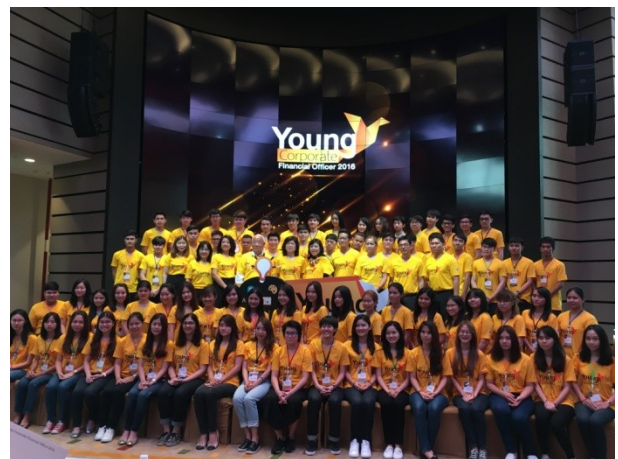
จัดโครงการ Young Corporate Financial Officer 2016

เมื่อวันที่ 23 มิถุนายน - 2 กรกฎาคม 2559