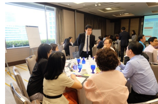
จัดหลักสูตร Enterprise Risk Management in Practice ครั้งที่ 2 เมื่อวันที่ 11 ตุลาคม 2559 ณ โรงแรมคราวน์ พลาซ่า ลุมพินี พาร์ค