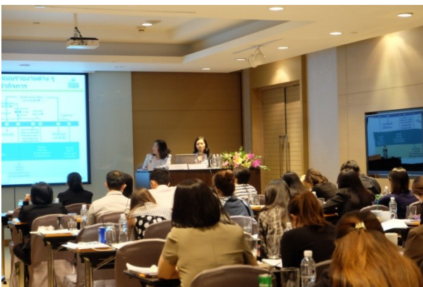
จัดหลักสูตรพื้นฐานเลขานุการบริษัท (หลักสูตร 3 วัน) รุ่นที่ 1/2559 เมื่อวันที่ 20 – 22 มิถุนายน 2559 ณ โรงแรมเจดับบลิว แมริออท