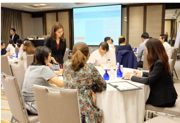
จัดหลักสูตร Enterprise Risk Management in Practice ครั้งที่ 1 เมื่อวันที่ 8 มิถุนายน 2559 ณ โรงแรมคราวน์ พลาซ่า ลุมพินี พาร์ค