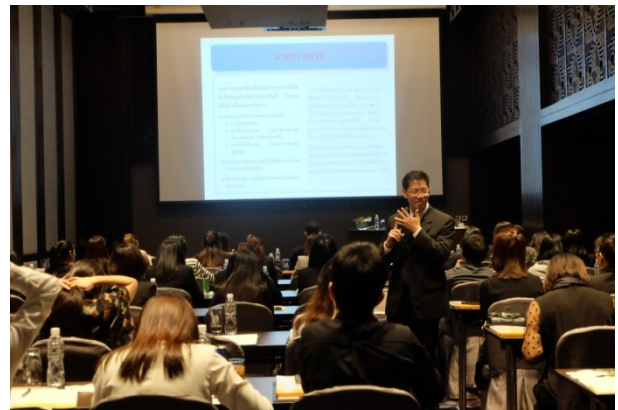
จัดหลักสูตรพื้นฐานเลขานุการบริษัท (หลักสูตร 3 วัน) รุ่นที่ 2/2559 เมื่อวันที่ 17 – 19 ตุลาคม 2559 ณ โรงแรมเจดับบลิว แมริออท