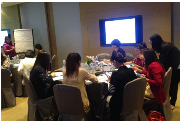
จัดหลักสูตรผู้ปฏิบัติงานเลขานุการบริษัท (หลักสูตร 4 วัน) รุ่นที่ 1/2559 เมื่อวันที่ 21 - 22 , 26 - 27 กรกฎาคม 2559 ณ โรงแรมเจดับบลิว แมริออท