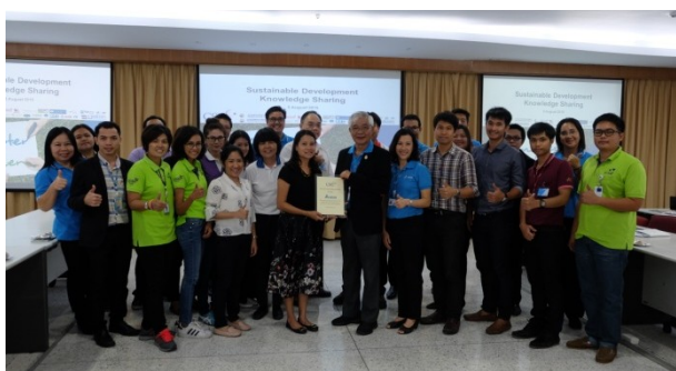
Company Visit ครั้งที่ 1 บมจ. เดลต้า อีเลคโทรนิคส์ (ประเทศไทย)