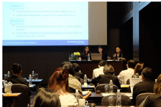
จัดหลักสูตรผู้ปฏิบัติงานเลขานุการบริษัท (หลักสูตร 4 วัน) รุ่นที่ 2/2559 เมื่อวันที่ 23 - 24 , 29 - 30 พฤศจิกายน 2559 ณ โรงแรมเจดับบลิว แมริออท