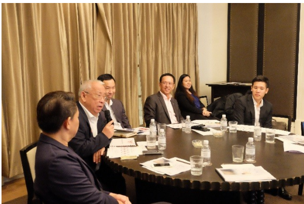
จัดงานสัมมนาร่วมกับบริษัท เอออน ฮิววิท (ประเทศไทย) จำกัด ในหัวข้อ“Managing Your Family Business Succession Management Professionally” เมื่อวันที่ 7 ตุลาคม 2559 ณ โรงแรม แกรนด์ ไฮแอท เอราวัณ