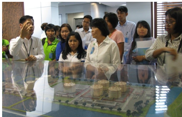
Company Visit ครั้งที่ 2 บมจ. บริการเชื้อเพลิงการบินกรุงเทพ