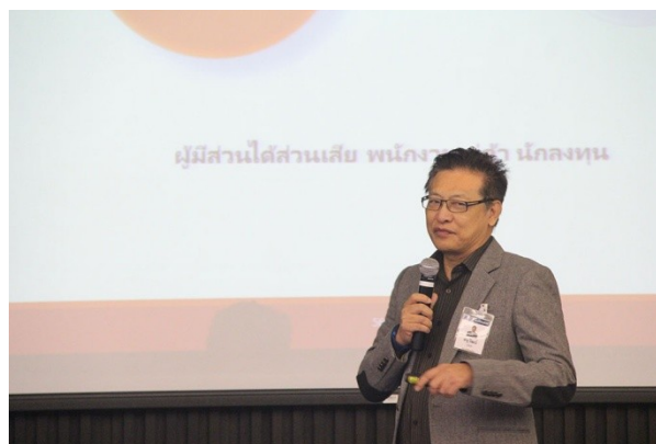
จัดงาน Experiences Sharing of CAC Certification Process เมื่อวันที่ 9 กันยายน 2559 ณ สถาบันวิทยากรตลาดทุน นอร์ธปาร์ค