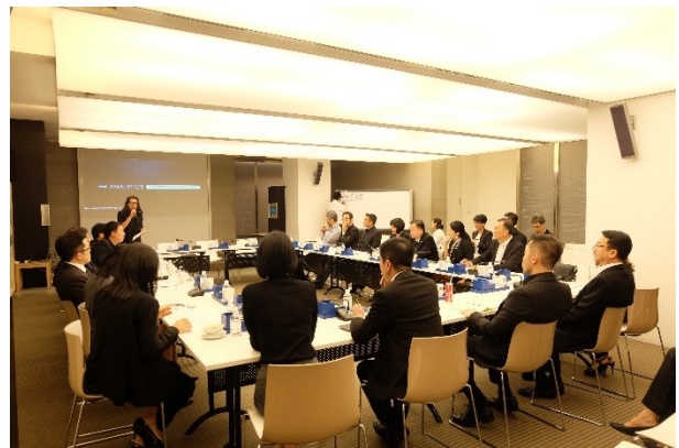
จัดงาน HR Pain Point Forum ในหัวข้อ “Managing HR Big Data for Strategic Decisions” เมื่อวันที่ 1 ธันวาคม 2559 ณ โรงแรมแกรนด์ไฮแอท เอราวัณ