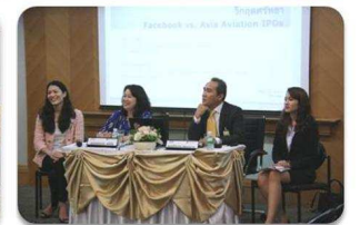
กิจกรรม IR Workshop และ IR Buddy Networking