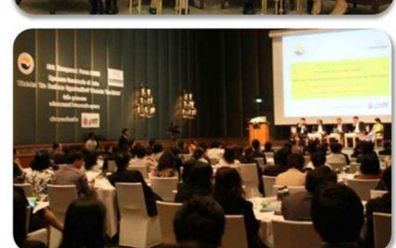
บรรยากาศงานสัมมนาประจำปี TLCA Annual Risk Management Conference 2012