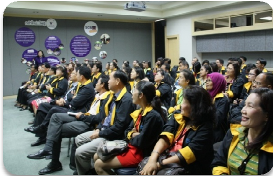
ศึกษาดูงาน บมจ. ธนาकारไทยพาณิชย์ และรับฟังเกี่ยวกับโครงการ “กล้าใหม่...ใฝ่รู้” โครงการที่จะช่วยผลักดัน ต่อยอด และเสริมสร้างให้เยาวชนไทยเติบโตเป็นทรัพยากรที่มีศักยภาพ