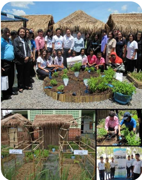
ส่งมอบแปลงเกษตรสาธิตแบบเศรษฐกิจพอเพียง ให้กับโรงเรียนที่เข้าร่วมโครงการ "คืนโรงเรียนให้ลูกหลาน สานสัมพันธ์ชุมชน"