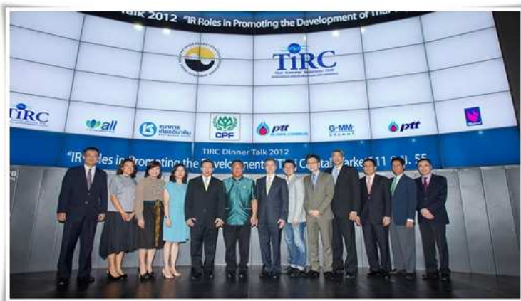
TIRC Dinner Talk 2012 : "IR Roles in Promoting the Development of Thai Capital Market" ในโอกาสครบรอบ 11 ปีของชมรมนักลงทุนสัมพันธ์แห่งประเทศไทย