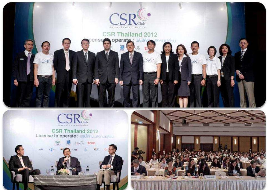
สัมมนาประจำปี CSR Club สมาคมบริษัทจดทะเบียนไทย "CSR Thailand 2012 - License to operate : ปรับให้ทัน...สังคมเปลี่ยน"