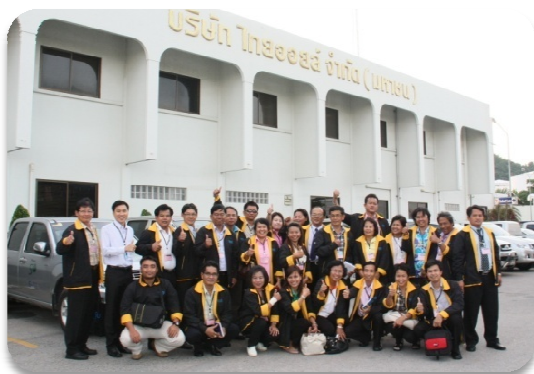
เยี่ยมชมและรับฟังแนวทางการดำเนินงานของโรงกลั่น บมจ. ไทยออยล์