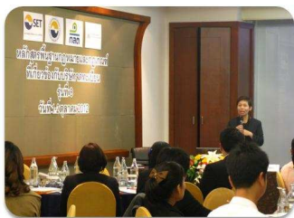
หลักสูตร "พื้นฐานกฎหมายและกฎเกณฑ์ที่เกี่ยวข้องกับบริษัทจดทะเบียน" และ "พื้นฐานสำหรับผู้ปฏิบัติงานเลขานุการบริษัท (FPCS)"