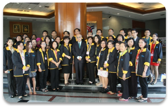
ศึกษาดูงาน บมจ. ระบบขนส่งมวลชนกรุงเทพ (BTS)