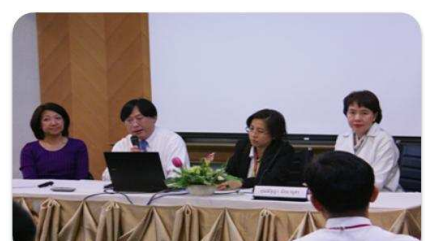
กิจกรรม Company Secretary Networking